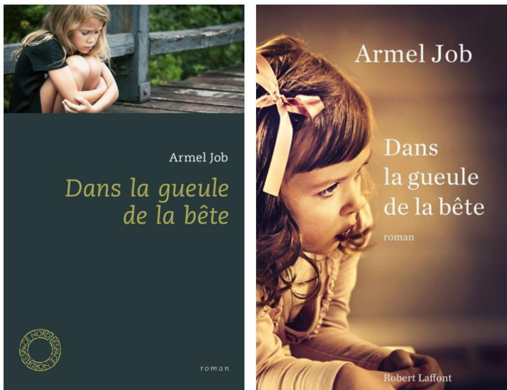
Couvertures Dans la gueule de la bête © Espace Nord 2016 et © Robert Laffont 2014