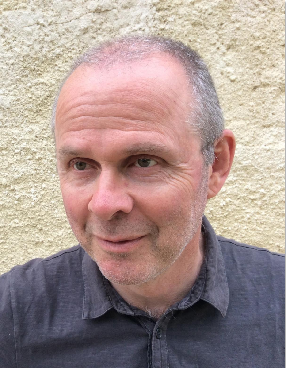
Portrait de Marc Pirlet © Marc Pirlet