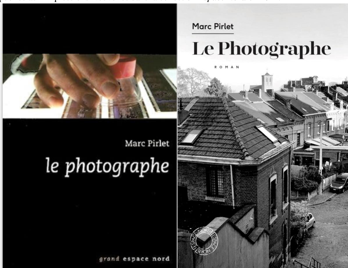
Couverture Le Photographe © Grand Espace Nord 2006 – Couverture Le Photographe © Espace Nord 2021

Voici les deux versions de la première de couverture du roman. La première version est celle publiée dans la collection Grand Espace Nord en 2006 et la deuxième version est celle publiée aux Impressions Nouvelles dans la collection Espace Nord en 2021.