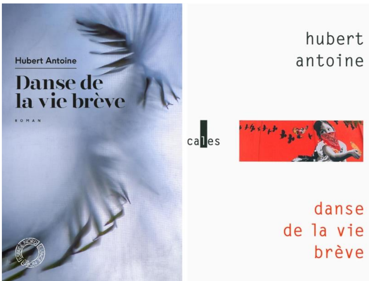
Couvertures Danse de la vie brève chez Espace Nord ©2023 et chez Verticales ©2016