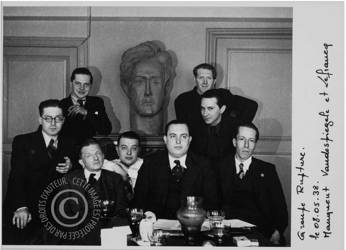
© Groupe Rupture La Louvière (AML 01342/0418)